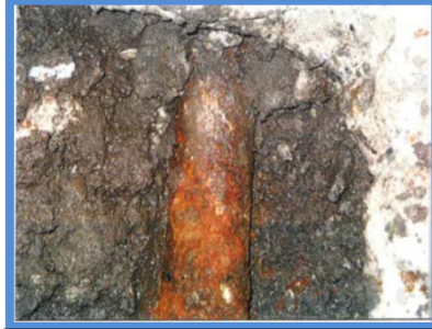
○埋設年数 : 43年 ○所在地 : 東京都