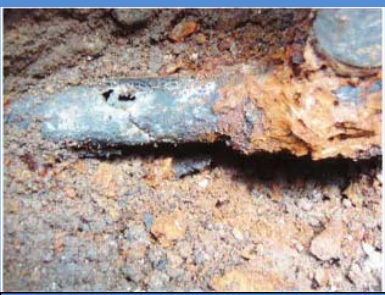
○埋設年数 : 41年 ○所在地 : 東京都