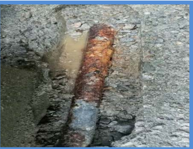
○埋設年数 : 40年 ○所在地 : 徳島県