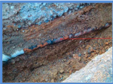
○埋設年数 : 41年 ○所在地 : 大阪府