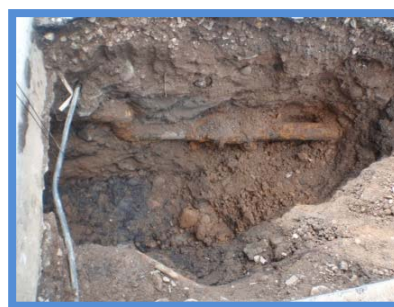
○埋設年数 : 38年 ○所在地 : 北海道