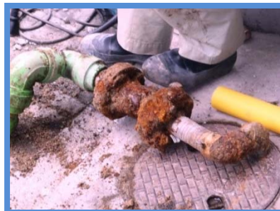
○埋設年数 : 50年 ○所在地 : 広島県