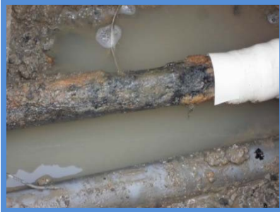
○埋設年数 : 45年 ○所在地 : 三重県