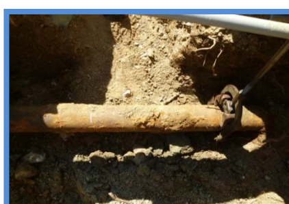
○埋設年数 : 40年 ○所在地 : 香川県